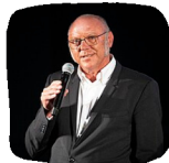
Ulrich Schneider Gesellschaft für Kommunikation und Soziales GKS Consult